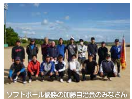
ソフトボール優勝の加藤自治会のみなさん