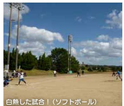
白熱した試合！(ソフトボール)