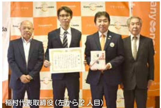
稲村代表取締役(左から2人目)