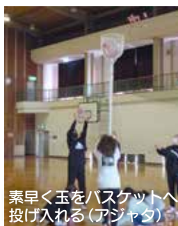
素早く玉をバスケットへ投げ入れる(アジャタ)