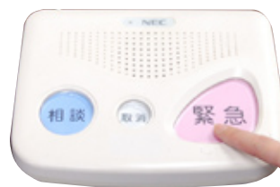
▼もしものときには緊急通報システムを使って連絡ができます。