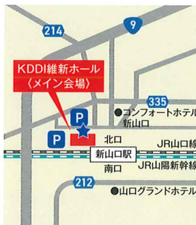
① KDDI維新ホール ★シャトルバス乗り場