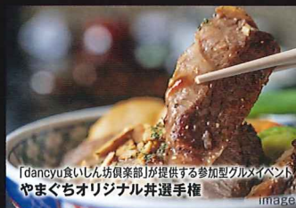
「dancyu食いしん坊倶楽部」が提供する参加型グルメイベント やまぐちオリジナル井選手権