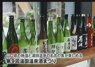
山口県の地酒と湯田温泉の名店の食が楽しめる 第9回湯田温泉酒まつり