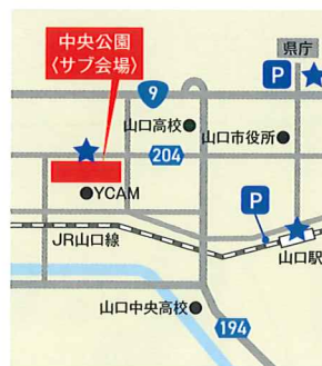
② 中央公園 ★シャトルバス乗り場