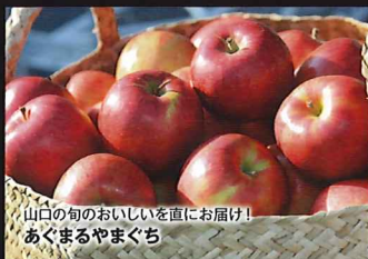
山口の旬のおいしいを直にお届け! あくまるやまぐち