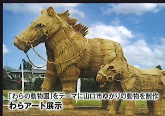
「わらの動物園」をテーマに山口市ゆかりの動物を制作 わらアート展示