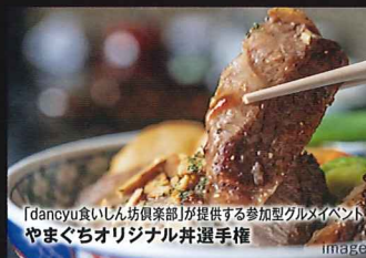
「dancyu食いしん坊倶楽部」が提供する参加型グルメイベント やまぐちオリジナル井選手権