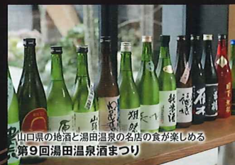
山口県の地酒と湯田温泉の名店の食が楽しめる 第9回湯田温泉酒まつり