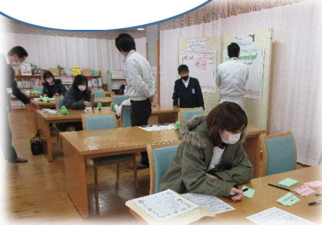
話し合いのようす

コロナ禍ということもあり、家で子どもとの過ごし方やおすすめ外出スポットなどを話し合いました。また、クリスマスツリーを作ったりと楽しい活動もありましたよ♪