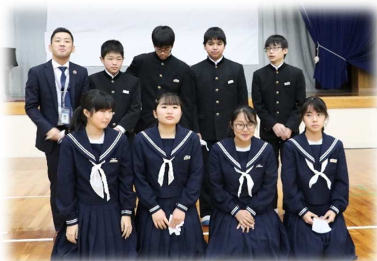
立志式を無事に終えて

立志式を終え、子どもたちも少し大人な表情になったのではないのでしょうか。これからも子どもたちの成長を見守っていただければと思います。