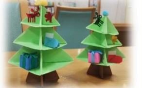
出来上がったツリー

次回は2月3日に小学校に入学される子の保護者・2月26日に中学校に進学される子の保護者を対象に、保護者同士の意見交換会を行う予定となっています。