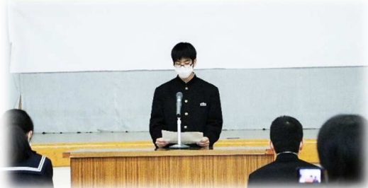
目標・決意を発表する中学生

1月22日(金)に、厚陽中学校にて立志式が開催されました。立志式とは元服にちなんで、14歳(数えて15歳)をお祝いする行事で、将来の目標や決意などを明らかにすることで、大人になる自覚を深める目的があります。厚陽の子どもたちも、自分たちの目標や決意を保護者や地域の方の前で、しっかりと語りました。保護者の方の中には、わが子の成長を目にして涙を流されるような場面も…。保護者からの応援メッセージと子どもたちの小さいころからの写真がスライドショーで流れるシーンもあり、改めて子どもたちの成長を感じることができたのではないのでしょうか。