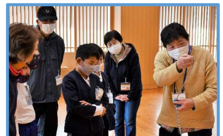
しっかりとルールを教わるようす

厚陽あそび隊は第2・4水曜日に行っています。安全管理員さんも随時募集しています♪