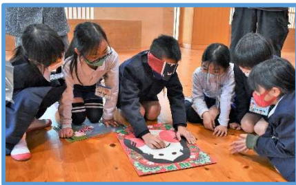
福笑いを楽しむ子どもたち