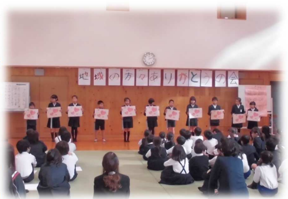
昨年の感謝の会のようす

地域の方のボランティア活動に対して、子どもたちから感謝を伝えるために開かれる感謝の会ですが、今年度は新型コロナウイルス感染症の影響で中止となりました。毎年この会を楽しみにされていた方も多くいらっしゃると思います。代わりに厚陽公民館に、子どもたちからのメッセージをパネル展示する予定となっています。ぜひ、地域の方に見に来ていただければと思います。(コロナ禍ですので密にならないように配慮をお願いいたします。)