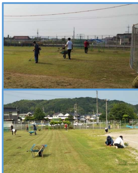
小学校グラウンド整備の様子

今後も PTA や学校だけでは手が足りないこともあります。その際、地域の力をお貸しいただけると心強いですね。また、今回草刈りに参加された PTA、学校関係者の皆様、暑い中の作業お疲れ様でした。