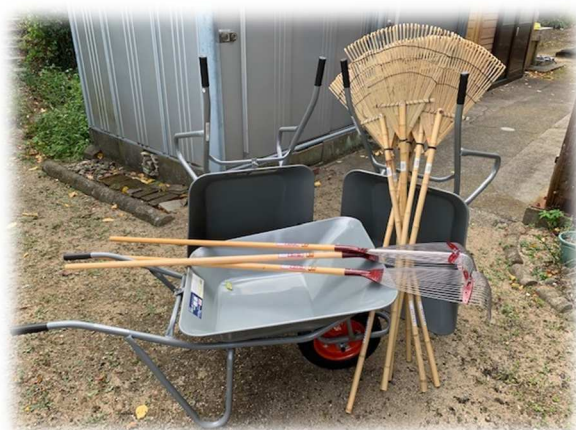
今回購入した一輪車とガンゼキ

古くなった道具を少しずつ新しいもの買い替えていければと考えていますので、今後も必要なものについて、購入を検討していこうと思います。