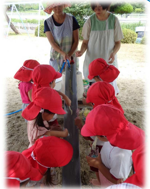
↑流しそうめんごっこ うまくつかめたかな?