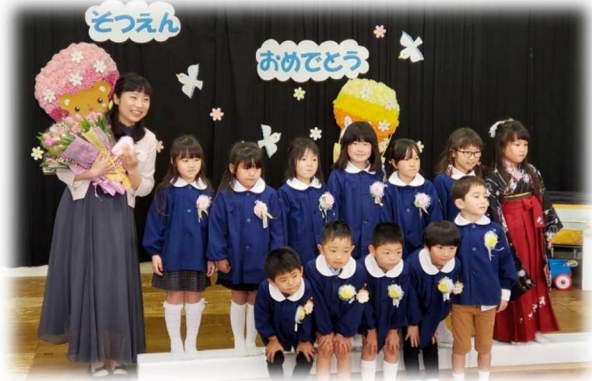
令和2年3月21日 厚陽保育園卒園式にて

新型コロナウイルスの影響もあり縮小規模での開催となりましたが、3月7日(土)に19名の中学生が厚陽中学校を卒業し、3月19日(木)に14名の小学生が厚陽小学校を卒業しました。また、3月21日(土)には12名の園児が厚陽保育園を卒園しました。