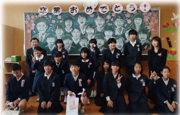
令和2年3月19日 厚陽小学校卒業式にて