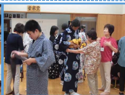
↑浴衣の着付け支援の様子