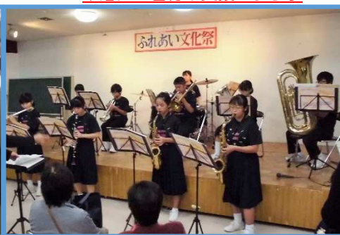
↑文化祭での brass band 演奏