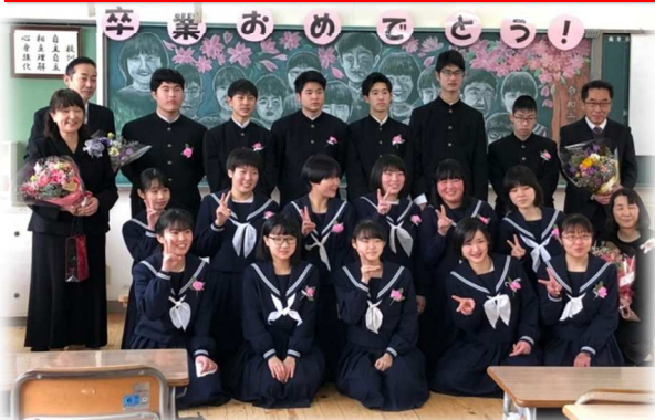
令和2年3月7日 厚陽中学校卒業式にて