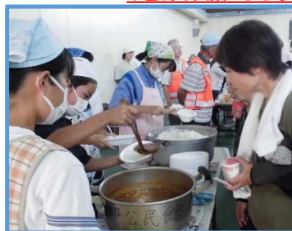
↑防災訓練での炊き出し