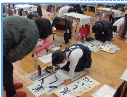
↑書初め支援の様子

これからも子どもたちを中心に考えながら、学校・家庭・地域で協力をし、厚陽地区を盛り上げていければと思います。