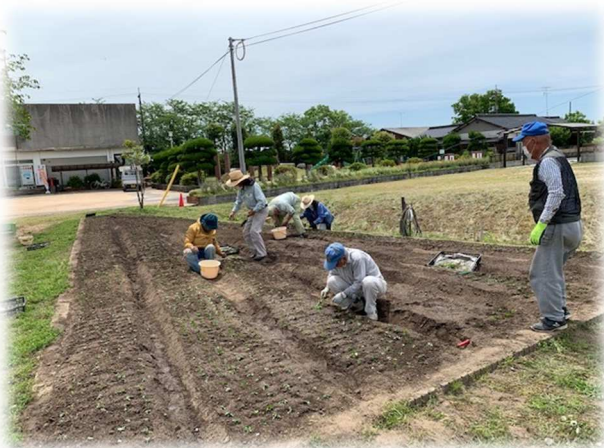
(マリーゴールドの移植のようす)

4月に種を蒔いたサルビアとマリーゴールドですが、今年は天候に恵まれ、たくさんの芽が出てきました。