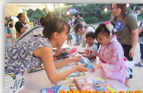
地域活動であいの出店

「であいふれあい盆踊り大会」が8月4日(土)に開催されました。今年の猛暑が続き暑い夏でしたが、暑さに負けずにみんなで盆踊りを楽しみました。小さい子どもや女性の浴衣姿も目立ち、和の心とふるさとの文化が感じられるひとコマでした。また、今年は小学校PTAの露天も出店し、地域活動であい、子ども会の露天とともに、小学生に人気のブースとなり地域行事が盛り上がりました。