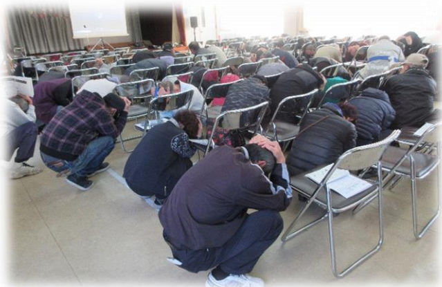
シェイクアウト訓練