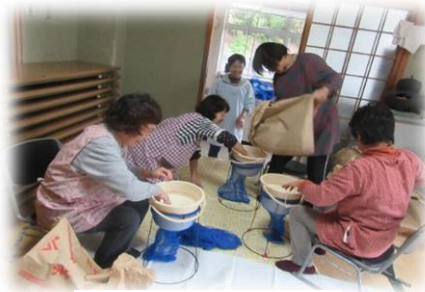
もち米洗いの準備

当日は、各クラブの芸能発表に加え、保育園児のかわいいダンスもあり花を添えてくれました。おかげで、芸能発表の会場も多くのお客であふれ盛り上がりました。