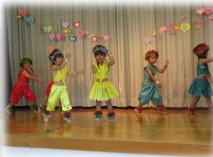
保育園によるお遊戯