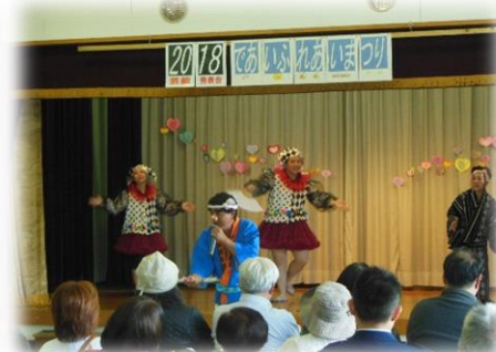
ありすの家による「ソングアンドダンス」