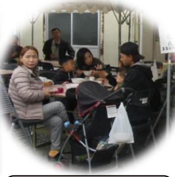
出合婦人会のうどんの味は毎年好評です。