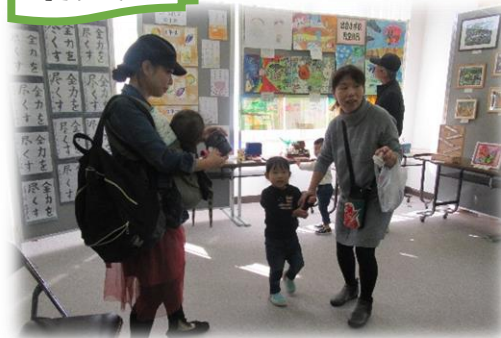
小・中学生と切り絵教室の作品展