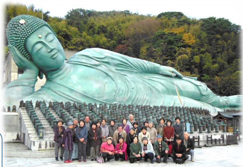
涅槃像の前で“はい！ポーズ”

缶ビールのおいしい注ぎ方を教えていただきました。おうちに帰って早速試されたという方もいました。