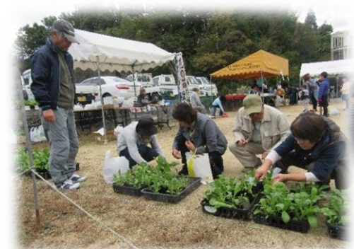
毎年、花の苗の販売もあります