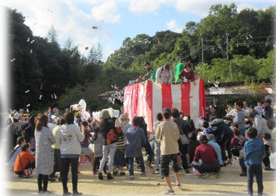
もちまき時には約250名が参加していましたが、大人も子どもも餅をたくさん拾って帰られました。