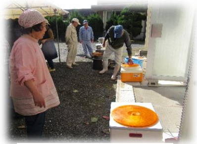
2台の機械で餅つき