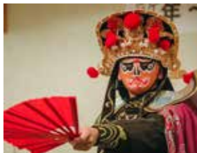
▲中国伝統芸能「変面」