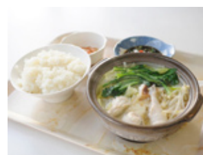
名物の「ふぐ鍋」定食▶

第1食堂は、市民の方も利用することができますので、みなさん是非ともご賞味ください。