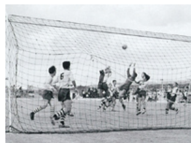
▲▼国体サッカー競技開催(高校の部)