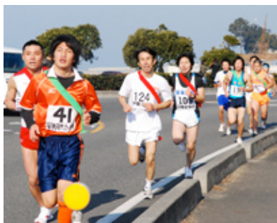
▲第42回大会のようす