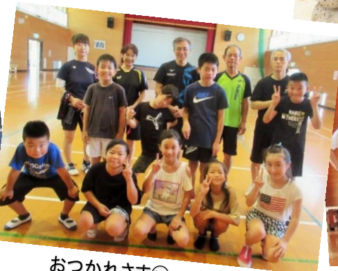
おつかれさま◎ハイチーズ