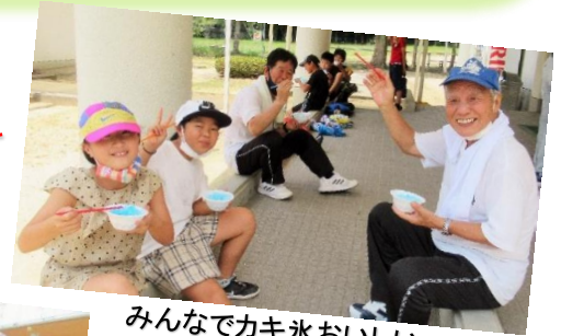
みんなでカキ氷おいしい～