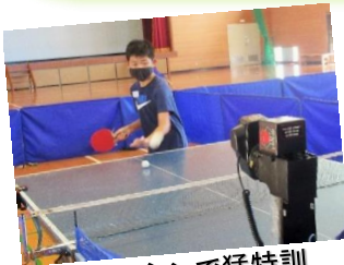
卓球マシンで猛特訓