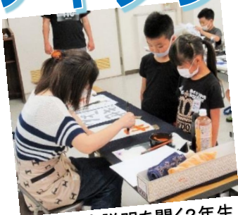
一生懸命説明を聞く2年生