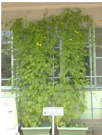
事務室西側緑のカーテン

今年の夏は、地球温暖化対策の一環として公民館事務室西側にゴーヤの「緑のカーテン」を育てました。夏の西日を和らげ、涼しげな環境で仕事をすることができました。来年も緑のカーテンにチャレンジします。