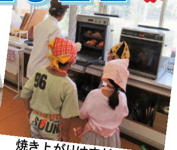
焼き上がりはまだかな？