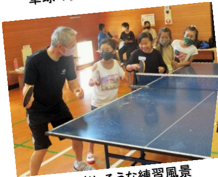
並んで楽しそうな練習風景