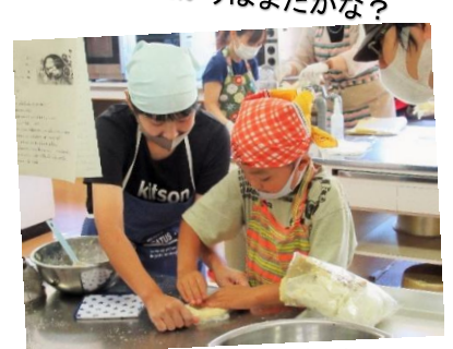
親子でお菓子づくり

夏休みこども教室（カローリング、習字、卓球、工作）と親子ふれあい教室（パティシエが教えるお菓子づくり）を開催し、たくさん子どもたちが参加してくれました。どんなことでも夢中で取り組む子どもたちの姿とそのパワーには毎年感心させられます。