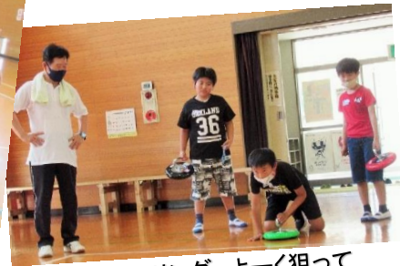
カローリング よく狙って