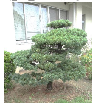
公民館玄関横の五葉松

ました。最初はうまく根付くか心配されていましたが、7カ月が過ぎ深緑が増えています。これから剪定するのが楽しみです。公民館にお越しの際は是非一見してみてください。