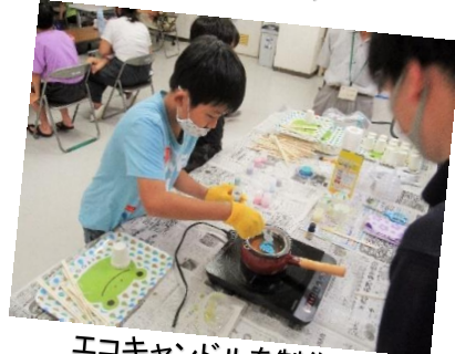
エコキャンドルを制作中