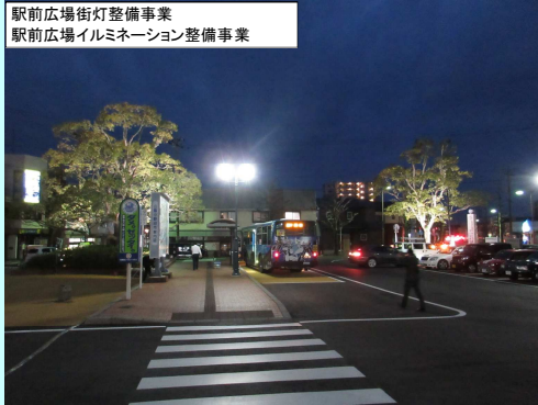
駅前広場街灯整備事業 駅前広場イルミネーション整備事業