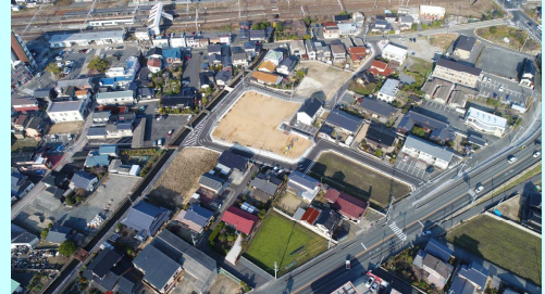
市道小野田駅前8号線整備事業 市道小野田駅前9号線整備事業 日の出公園整備事業 日の出地区生活道路整備事業