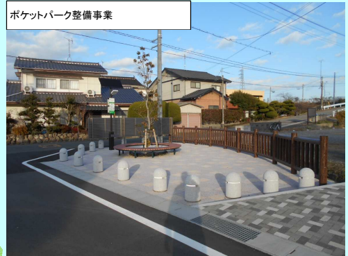
ポケットパーク整備事業