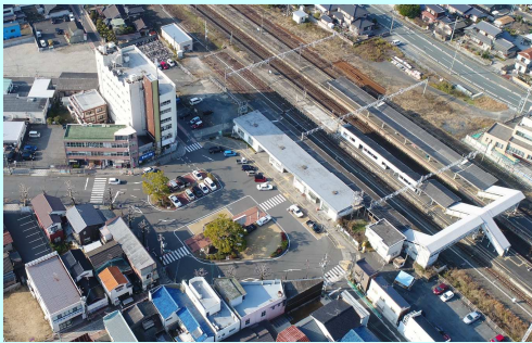
駅前広場美装化整備事業