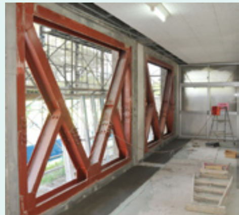
▲工事中の須恵小学校管理特別教室棟

須恵小学校、赤崎小学校、厚狭小学校、出合小学校、高千帆中学校、厚狭中学校、埴生中学校、赤崎小学校・竜王中学校松原分校