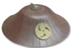
やぶい 楊井家所蔵 じんかさ 「陣笠」