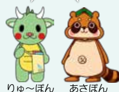
りゅーぼん あさぼん