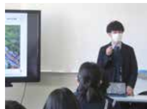
㊤ 学校教育課 (☎ 82-1201)

また、高千帆中学校では地域のみなさんを迎え、職業人の知識や技能に直接触れる学習を行い、厚狭中学校では地域のみなさんと中学生が直接顔を合わせて、自分と社会とのつながりを語り合う「厚狭人ダイアログ」などの学習を行いました。