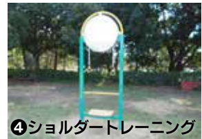
④ショルダートレーニング 肩部の強化・ストレッチ