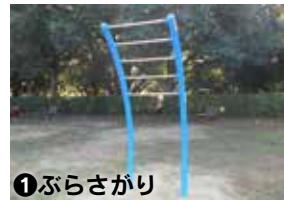
①ぶらさがり 背筋・腹筋の強化