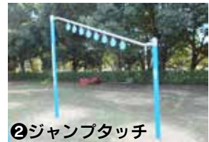
②ジャンプタッチ 脚力・瞬発力の強化