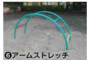
⑥アームストレッチ 腕力・腹筋力の強化