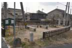
▲ポケットパーク3号地 (さくらほっとパーク)

Profile ・山陽小野田市出身。光市の異設計コンサルタントに60歳定年まで勤め、定年後は実家の石材店を引き継ぐ。自身の建築事務所を営む傍ら「厚狭 杜のまち」の代表を務め、教師や住職、酒屋、英会話教師、医者、陶芸家などのメンバーで活動している。現在ポケットパークは2か所。休憩スポットやイベントの会場としてまちに彩りを添えている。