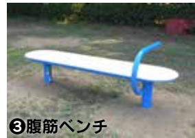
③腹筋ベンチ 腹筋の強化・ 足腰の柔軟性の向上