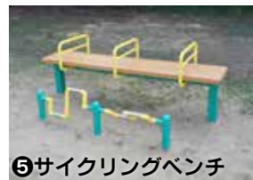
⑤サイクリングベンチ 脚部の強化