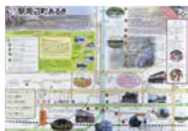
▲厚狭 杜のまち発行「厚狭駅周辺町あるき」マップ