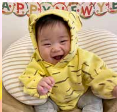
やました かいと 山下 快斗くん (7か月) 今年も笑顔で過ごせますように☆

〒756-8601 山陽小野田市役所 シティセールス課広報係 (☎82-1148)