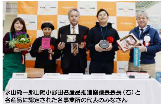
永山純一郎山陽小野田名産品推進協議会会長（右）と名産品に認定された各事業所の代表のみなさん