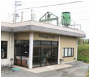
▲タルちゃんプラザ

ついでに、という語弊がありますが、みなさんは「タルちゃんプラザ」をご存知ですか。おのだサンパークの近くにありま