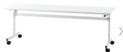
テーブル（イメージ図） （幅 1500、奥行 600、高さ 700）

1階の小会議室が小野田ふれあい相談室となるため、2階の和室の利用が増えることが予想される。そのため、和室で利用する会議用テーブルと椅子を購入する。