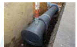
GX形ダクタイル鋳鉄管

FE接合(電気融着)により、管路が一体化することで継手の抜けがありません。また管自体の柔軟性に優れ、地震発生時の地盤変動に合わせて管自体がたわむことで管路の破損を防ぎます。