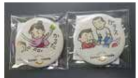
▲イラスト缶バッジ(一部) ▼おのだサンパークほか、市内9か所に設置

※新型コロナウイルス感染症拡大防止のため、スタンプラリーポイントの一部施設を休館する場合があります。ご協力をお願いします。