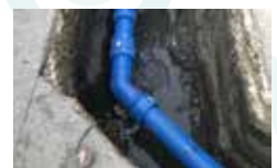
配水用ポリエチレン管