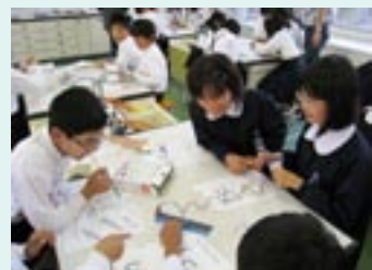
▲実験の楽しさを体験して、思わずにっこり。

みんな夢中になって実験に取り組み、小学校では見たことがない実験道具にもとても興味を持った様子で、教室内は笑い声や驚きの声でとても賑やかでした。