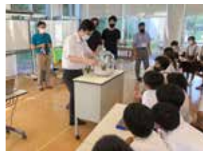
㊤ 学校教育課 (☎ 82-1201)

昨年 11 月に、市内小中高校、山口東京理科大学が包括教育連携・協力に関する協定を締結し、一貫した教育を推進しています。その取組の一つが、山口東京理科大学が小中学生を対象に行う出前授業「ほんものの科学体験講座」です。普段体験できない科学実験が行える貴重な機会であり「低音の世界」「ドローンを学ぼう！」などの 17 講座が予定されています。7 月 14 日には、高泊小学校の 5・6 年生が「真空ショー」の講座を受講。容器の中に、穴をあけた缶コーヒーを逆さまに入れて真空にした場合どうなるかを観察し、真空(宇宙)とはどういう状態なのかを考えるという内容でした。受講した児童からは「いろいろな実験があって理科ってこんなにもしろいんだと思った」「科学は、わからないことがいっぱいあって興味がわいた」という感想があり、学ぶ喜びを実感できる機会となりました。