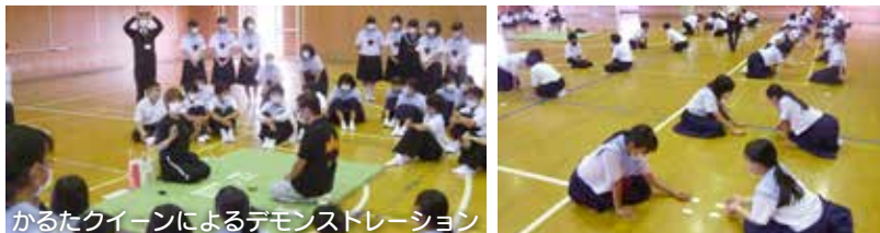
かるたクイーンによるデモンストレーション