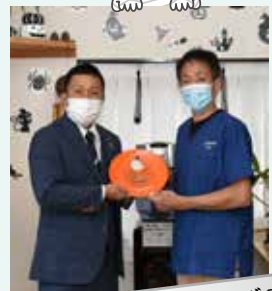
2020年ディスプレイコンテストグランプリ

参加申込書に必要事項を記入し、スタジオ・スマイル事務局（シティセールス課内）に持参またはFAX、E-mailで申込み ※参加申込書は公式ホームページからもダウンロードできます。