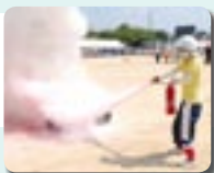
▲昨年の訓練の様子