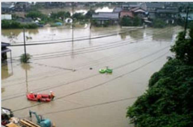
▲冠水地域へ救助ボート