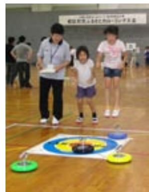
▲校区対抗ふるさとカローリング大会

山陽小野田市ふるさとづくり推進協議会は、今年度、財団法人自治総合センターの一般コミュニティ助成事業の採択を受け、地域活動に必要な備品を整備しました。購入物品は、高齢者から子どもまで一緒に楽しめる新しいスポーツ“カローリング”の道具8セットで、7月20日に開催された『校区対抗ふるさとカローリング大会』でお披露目されました。同協議会では、今後要望を受けて地域や学校への備品貸出しも行き、カローリングの普及を通して、地域間・世代間の交流を図っていきます。●担当：市民活動推進課 (☎ 82-1134)