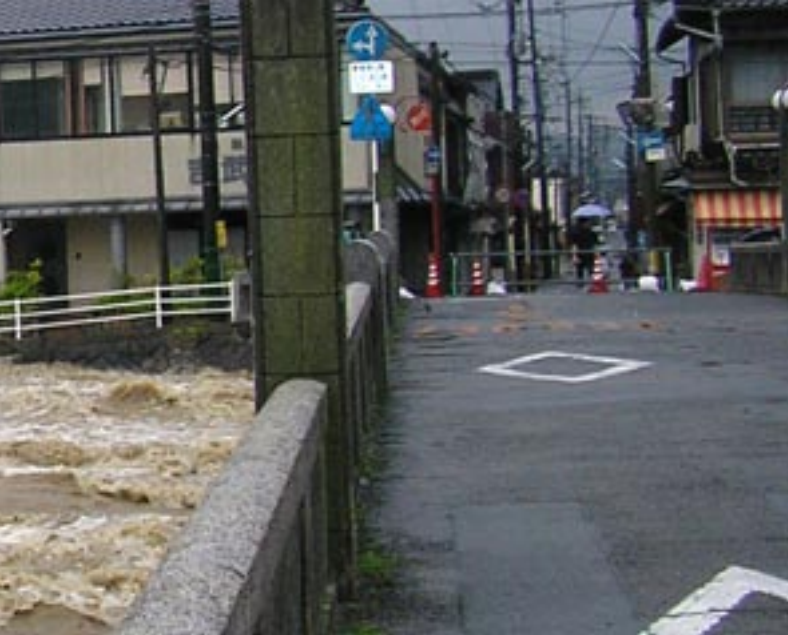
▲警戒水位を超える厚狭川鴨橋付近