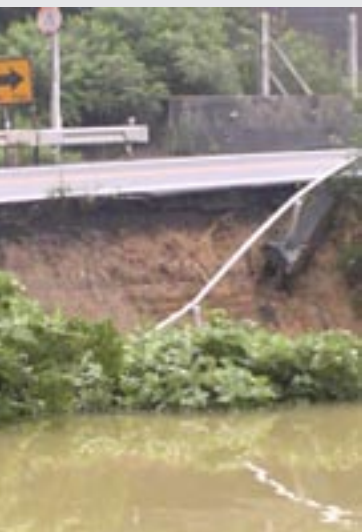
▲市道談合道・上市線