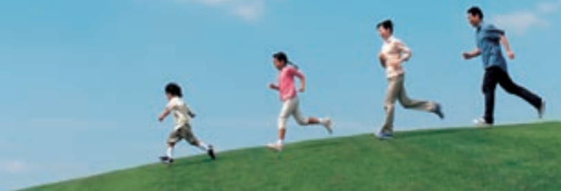
「人権に関する県民意識調査」 2008年9月実施

「人権」。聞くだけで難しく考えてしまいがちですが、私たち一人ひとりが幸せに暮らすための大切な権利です。今回は「人権」について少し考えてみましょう。【担当】社会教育課（☎ 82-1203）