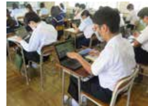
図 学校教育課 (☎ 82-1201)

本市の小中学校では、平成 18 年度からモジュール学習に取り組んでおり、市の教育の特色の一つとなっています。モジュール学習は、15 分を一単位時間として「読み・書き・計算」の基本を徹底反復することで、脳を鍛え活性化することを目的に実施しています。今年度からは、1 人に 1 台のタブレット型端末が整備されたことで、AI(人工知能)ドリルという教材ソフトを活用したモジュール学習に取り組んでいる学校もあります。AI ドリルを利用することにより、子どもの解答を分析し、個々の習熟度に応じた学習ができます。生徒からは「パソコン操作にまだ慣れていないので難しいけれど、頑張っていきたい」「平均正答率などがすぐに示されるので、自分自身で達成度が分かりやすい」といった声が聞かれました。これからも、タブレット型端末を活用しながら、モジュール学習の新たな取組を進めていきます。