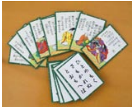
▲楽しくかるたと触れ合えます