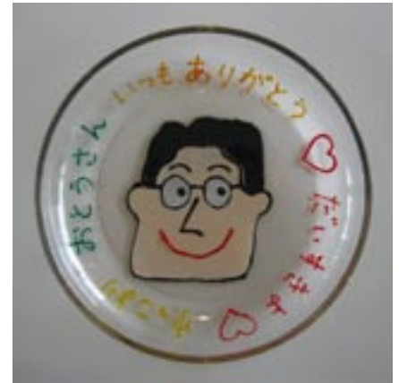
▲エナメル絵付け作品