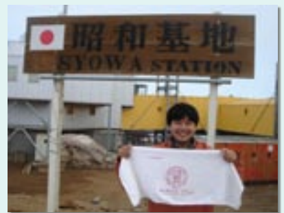
▲南極昭和基地にて。

これから様々な機会を通して、私が南極で体験したたくさんのことを、山陽小野田市のみなさんの前でお話しして行きたいと思えます。よろしく願いいたします。