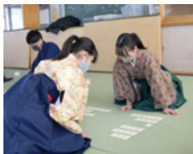
▲試合形式での練習

Profile・山口県立小野田高等学校2年生。小倉百人一首かるた部所属。部長として1、2年生合わせて23人の部員を率いる。