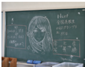
▲目標が書かれた部室の黒板