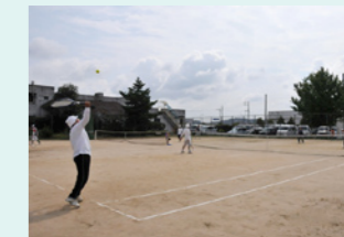
下村テニスコート