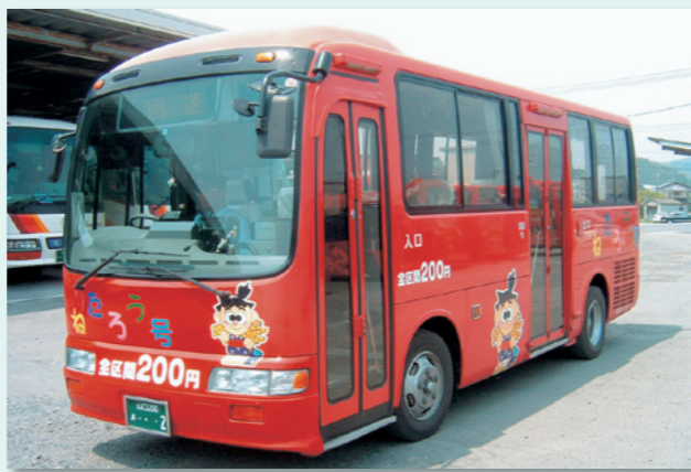
▲厚狭地区と厚陽地区を結ぶ「ねたろう号」。

〒756-8601 山陽小野田市日の出一丁目1番1号 商工労働課 (☎ 82-1150 / FAX 83-2604) E-mail: shoukou@city.sanyo-onoda.lg.jp