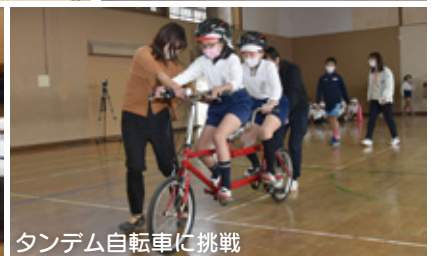
タンデム自転車に挑戦