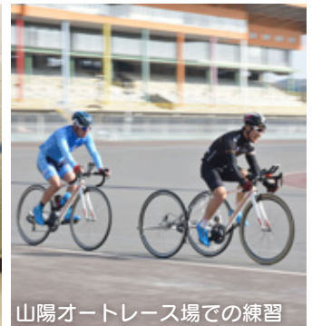
山陽オートレース場での練習