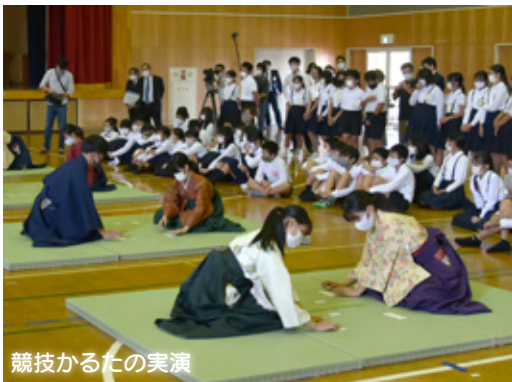
競技かるたの実演

小野田高校小倉百人一首かるた部と竜王中学校が平成30年度から実施しているかるた交流会に、今年は本山小学校、赤崎小学校が加わり、10月13日、竜王中学校において、4校の児童生徒がかるたを通じて交流しました。高校生が競技かるたのルールや札の暗記方法等の説明とデモンストレーションを行った後、高校生对各学校の代表との対戦や中学生対小学生の試合を行いました。最後に小中学生は3人でチームを組み、高校生1人と対戦。高校生の札を取るスピードに苦戦しながらも、中には高校生に見事勝利するチームもありました。参加した児童は「さすがは高校生。強くて驚いた。来年から竜王中学校で共に過ごす仲間と交流ができてよかった。かるたの魅力を下級生にも伝えたい」と感想を述べました。