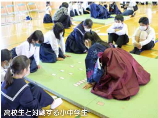
高校生と対戦する小中学生