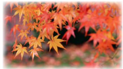
小野田高等学校小倉百人一首かるた部 顧問 青池 のぞみ

在原業平は、平安時代のプレイボーイで、『伊勢物語』の主人公のモデルとして有名です。つきあった恋人は、3,733人もいた！とまで言われています。この歌は、競技かるたの漫画のタイトルにもなりましたが、実際は、紅葉の名所の竜田川で詠まれたのではなく、紅葉を描いた屏風絵を前にして詠んだ「屏風歌」です。この時代には、競って「屏風歌」を詠む遊びが風流なものとして流行しました。この歌の屏風絵は、清和天皇の皇后高子の屏風です。『伊勢物語』には、業平と高子が身分違いの恋に落ち、駆け落ちをしましたが、彼女の兄に連れ戻されて涙にくれるという名場面があります。この結ばれない二人の恋があったからこそ、この「屏風歌」に込めた業平の特別な想いが伝わり、切なくもロマンチックな歌として後世に残ったのでしょうか。