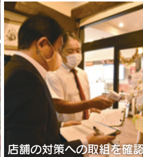
店舗の対策への取組を確認