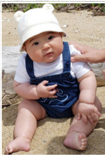
「かわいく元気に育っています!」