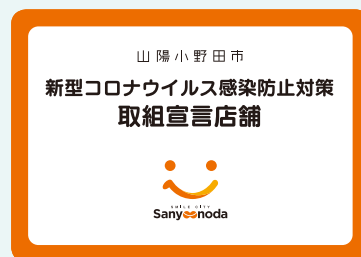
スマイルステッカー