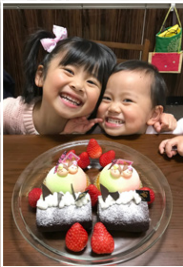
「この笑顔のためにがんばるね!」