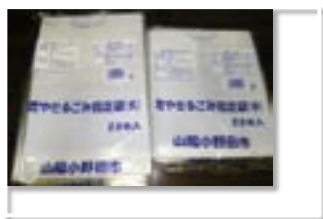
現在の指定ごみ袋→