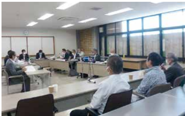
懇談会の様子（食品衛生協会）