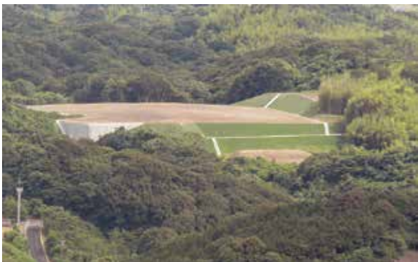
レーダー基地の建設現場

A 宇宙ごみや対衛星兵器などを常時監視する専門部隊と聞いている。住民の不安があれば、国がしっかりと説明をすることが責務と考えている。