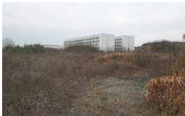
まだまだ課題の残る大学整備

A 再発防止という観点においての職場環境づくり、これは組織としての大きな仕事の一つである。反省すべき点があればしっかり次への体制づくりに生かしていくことを肝に銘じて進めていきたい。