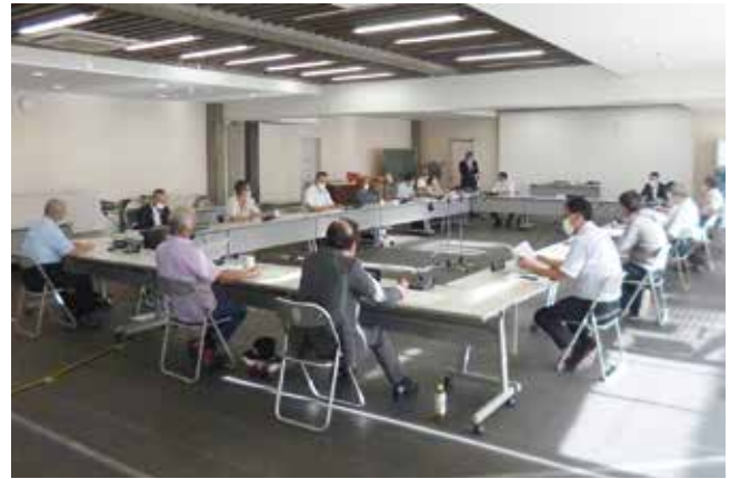
6月30日に行われた意見交換会

特に、本会議の一般質問については「市長からの答弁が引き出せるように努力すべき」など、時間をかけて熱の入った意見が出されました。