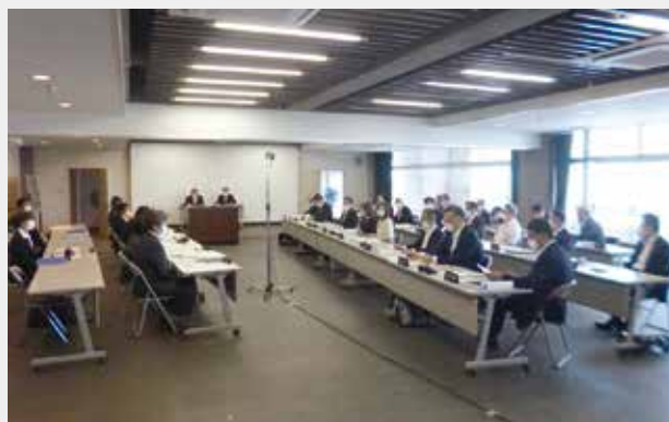
大会議室での本会議