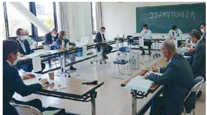
懇談会の様子（山陽商工会議所）