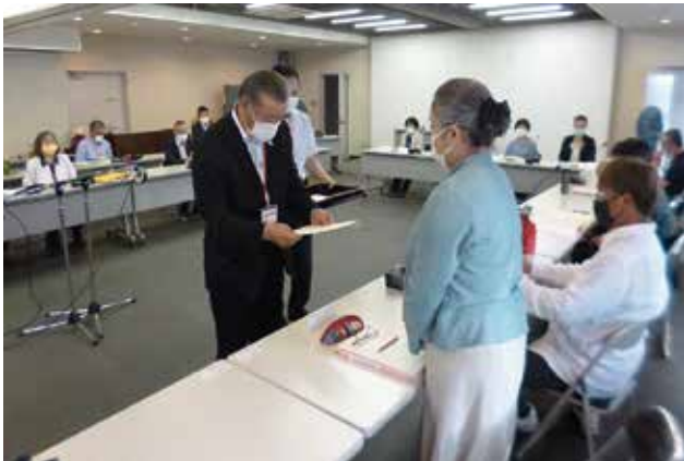
7月2日、議長が一人一人委嘱状を交付