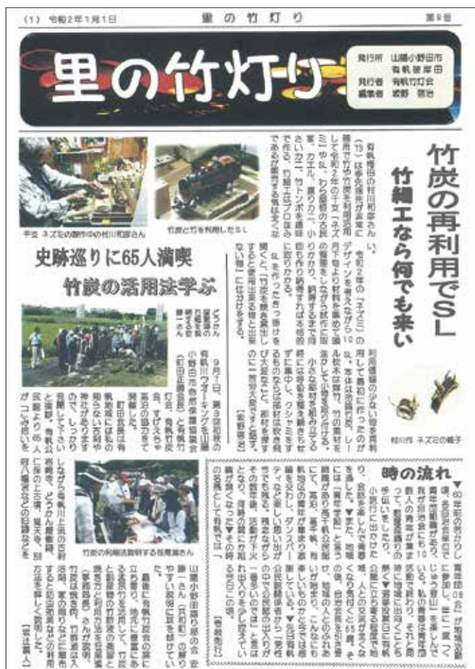
有帆竹灯会の機関誌「里の竹灯り」