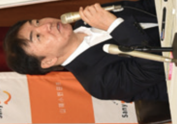
山陽小野田市市長 藤田剛一