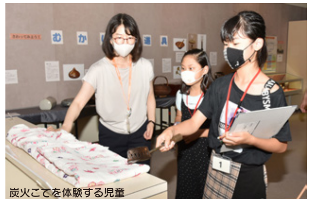
炭火こてを体験する児童

7 月28日、新型コロナウイルス感染症対策に関する提言書を、小野田青年会議所が市長に提出しました。感染拡大が教育や経済、市民生活等へ影響を及ぼす中、活発な市民活動が再び戻ってくるよう、教育環境の整備や第2波に備えた経済支援の継続等を提言しました。