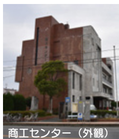
商工センター（外観）

市は、商工センターの跡地を活用した再開発をこれまで国内で事業化された事例がないLABV（Local Asset Backed Vehicle 官民協働開発事業体）の手法で取り組むこととし、7月28日、商工センターで事業パートナーである小野田商工会議所および(株)山口フィナンシャルグループの3者で合同記者会見を行いました。