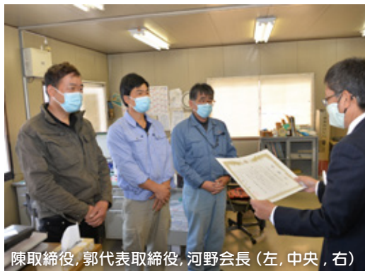
陳取締役、郭代表取締役、河野会長（左、中央、右）

寄附していただいたマスクは、市内の一次救急病院および急患診療所で活用させていただきます。ありがとうございました。