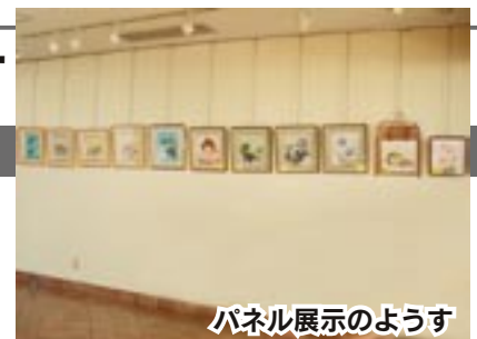
パネル展示のようす