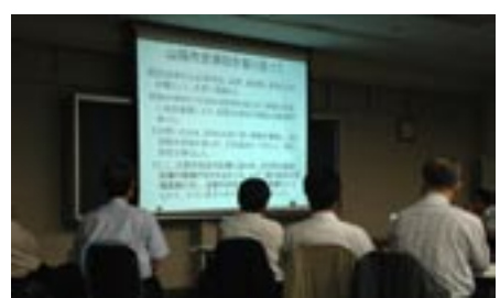
▲8月8日に行われた2回目の会議のようす

当委員会では、新病院の建設に関すること、病院事業を運営するうえで必要なことについて調査、検討されます。