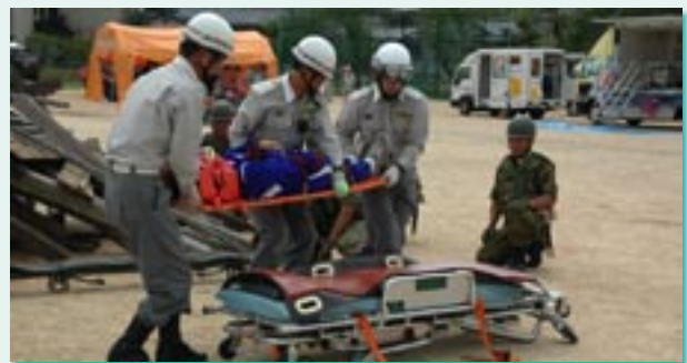
▲昨年行われた同訓練の様子

※津布田小学校周辺のみなさんには、騒音等でご迷惑をおかけしますが、ご協力をお願いします。