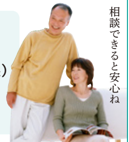
相談できると安心ね