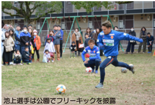
池上選手は公園でフリーキックを披露