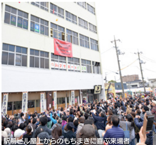
駅前ビル屋上からのもちまきに喜ぶ来場者