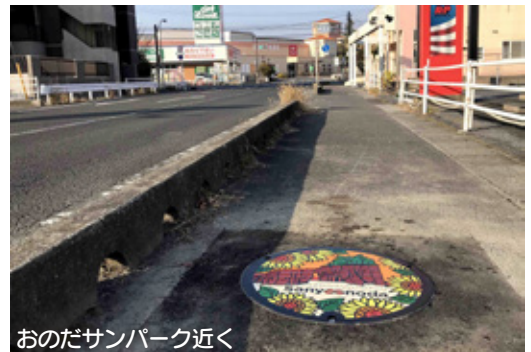
おのだサンパーク近く