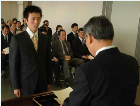
▲新入職員への辞令交付（4月2日 市役所）

さて、市役所の4月は新しい年度のはじまりです。季節の移り変わりを感じずる余裕もなく、財政問題をはじめ、引き続き多くの難題・課題に忙殺されています。今年度は、今までにもお伝えしてきましたが、ソフト面の前向きな取組みをすすめていくつもりです。具体的には自治基本条例の制定に向けての本格的な作業の開始、そして市のこれから先、10年後までの道標となる総合計画の策定などがあげられます。総合計画については、この号にありますように、できあがった素案について市民のみなさんに意見をおうかがいする段階となりました。記事でもご紹介しましたが、多くの方のご参加をいただいてできあがった素案です。ホームページに全文を掲載していますので、ポリュームがありますが、興味をお持ちの方は、ご覧になってご意見をお寄せください。