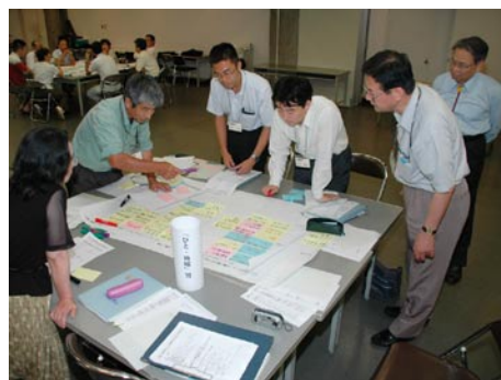
▲まちづくり市民会議「総合計画」部会のようす

委員 40人（学識経験者等 30人 公募市民等 10名）が、それぞれの立場や経験を基に、計画の内容について審議を行っています。7月開催の第5回の審議会で答申をいただく予定です。（平成 18 年 4 月～）