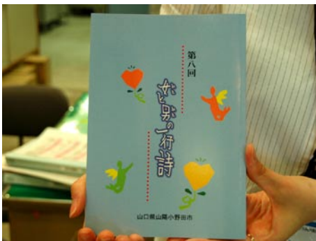
▲「女と男の一行詩」の取組みは啓発活動として高い評価を受けています

このプランは男女共同参画社会基本法に規定する、男女が互いにその人権を尊重しつつ責任も分かち合い、性別にかかわらず、その個性と能力を十分に発揮することができる男女共同参画社会の形成の促進を図るため、山陽小野田市男女共同参画推進条例に基づいて、男女共同参画に関する施策の基本的な計画を定めるものです。