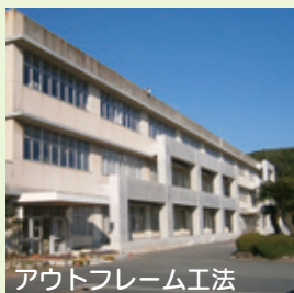
アウトフレーム工法

大規模な地震が発生しても倒壊せず、行政機能を維持できるよう、本庁舎本館の南北に鉄骨鉄筋コンクリートのアウトフレーム※を新設します。