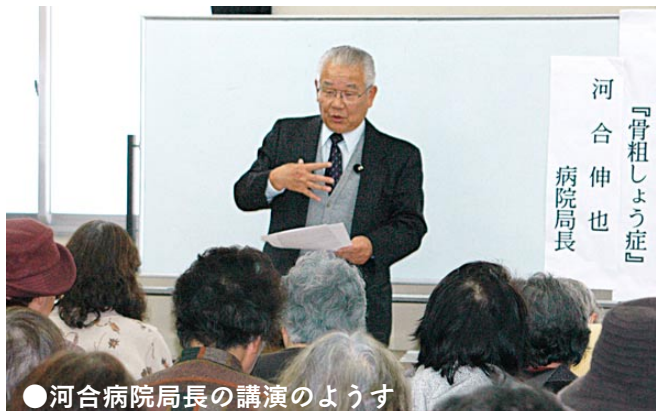
●河合病院局長の講演のようす

1月25日、山陽市民病院で「骨粗しょう症」をテーマに、第1回目となる「健康講座」を開催しました。当日は、市外からの参加者も含め58名もの方にご参加いただきました。