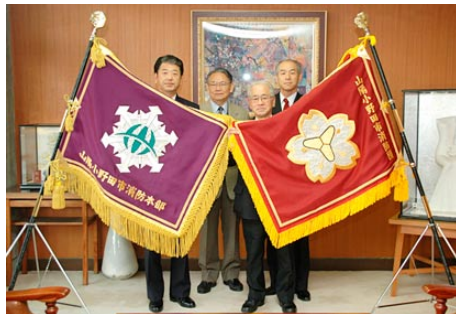
▲新しい消防本部旗 (左)・消防団旗 (右)

このたび、消防本部・消防団では消防の象徴である「消防本部旗」「消防団旗」を新たに作成しました。これらの旗のもとに消防職員・消防団員が一致団結して、市民のみなさんの安心・安全確保のため、より積極的な消防行政を推進していきます。