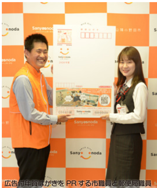
広告付年賀はがきをPRする市職員と郵便局職員