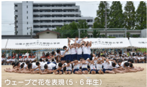
ウェーブで花を表現(5・6年生)