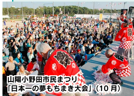
山陽小野田市民まつり 「日本一の夢もちまき大会」(10月)