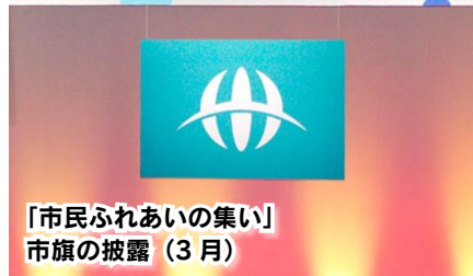
「市民ふれあいの集い」 市旗の披露 (3月)