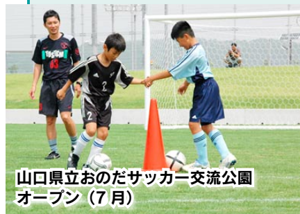
山口県立おのだサッカー交流公園 オープン (7月)