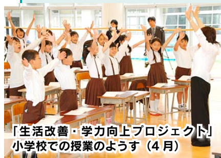
「生活改善・学力向上プロジェクト」 小学校での授業のようす (4月)